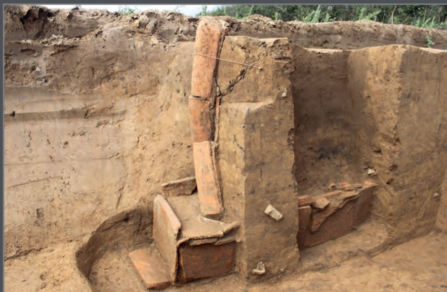
Tombe féminine à libation