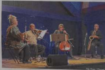
→ « Entre les Terres » a exécuté des œuvres composées par deux de ses membres