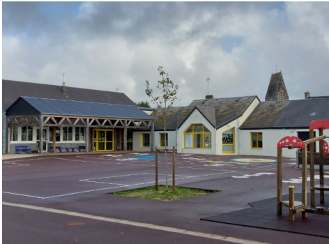
L'école des Mielles