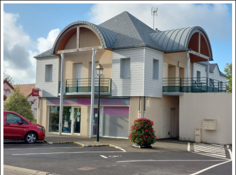
Boulangerie-Épicerie du Bourg