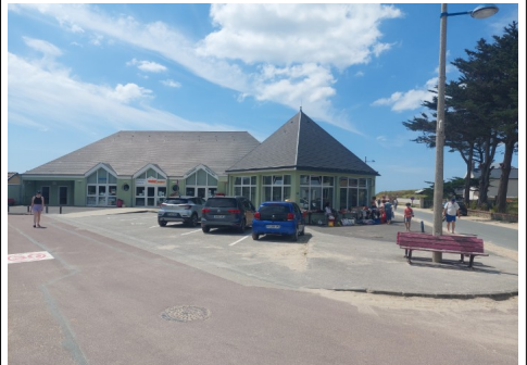
Commerces saisonniers Denneville-Plage