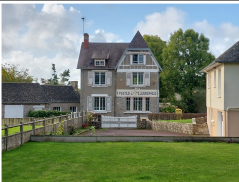
Agence Postale Communale